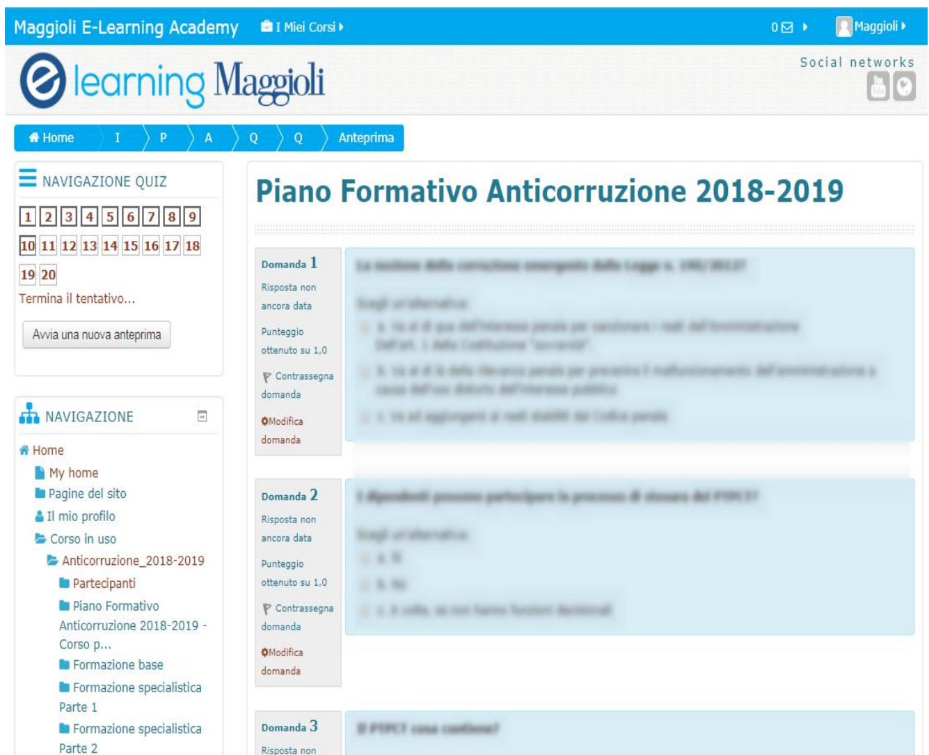
Figura 5 - Esempio di questionario