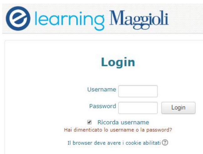
Figura 1 - pagina di login

La piattaforma per l'erogazione dei contenuti della Formazione a Distanza è basata su un Learning Management System Open Source raggiungibile via Internet attraverso un generico browser (come spiegato più avanti), senza necessità di installazioni di software dedicato e l'accesso avviene grazie all'inserimento di username (solitamente l'email del partecipante) e password fornita in sede di iscrizione al corso (tramite questa pagina con un semplice click, è possibile recuperare le credenziali di accesso) (Figura 1)