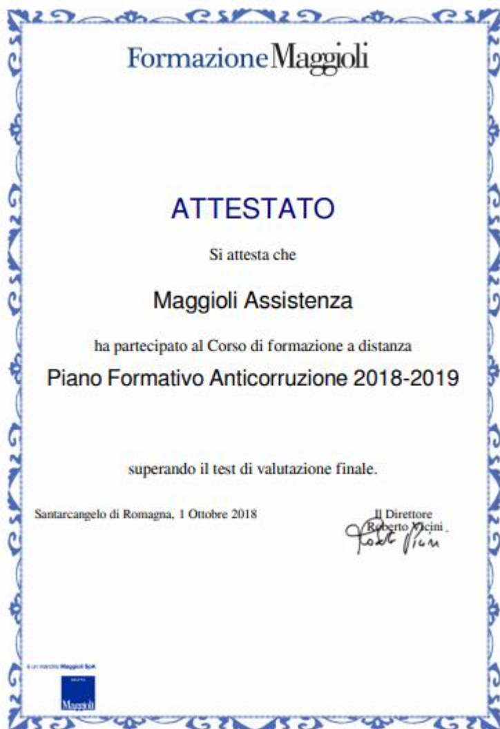
Figura 6 - Esempio di attestato

Il documento è un file di tipo pdf che l'utente può conservare e stampare, ecco un esempio nella figura 6: