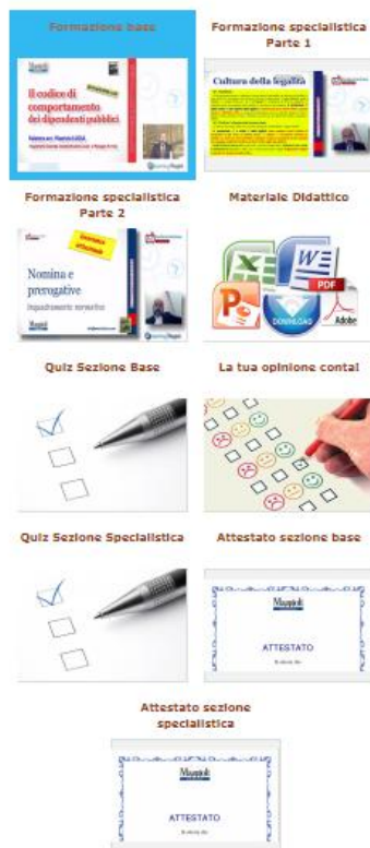
Figura 4 - Moduli operativi

Al centro della pagina ci sono i moduli operativi (Figura 4) con i quali è possibile navigare i contenuti partendo dal primo in alto a sinistra per terminare con l'ultimo in basso.