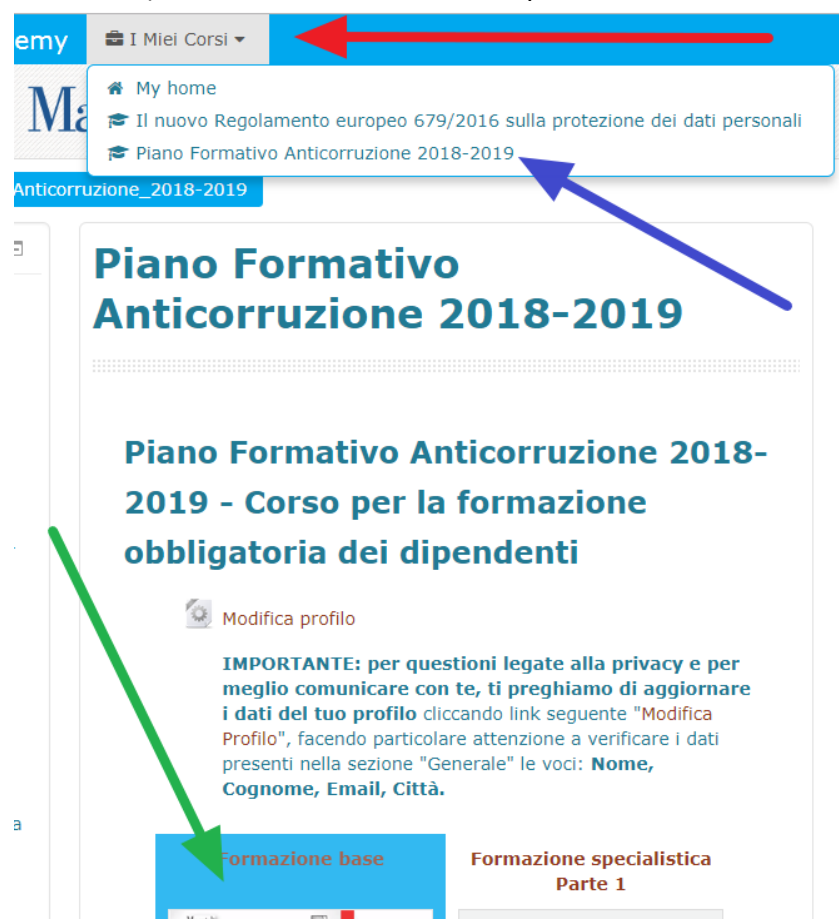
Figura 2 – scelta del corso e inizio corso

Appena entrati dal menù "I Miei Corsi" (Indicato nella Figura 2 – con la Freccia Rossa ) si sceglie il corso che si vuole seguire (Freccia Blu ), poi appare quanto sotto, (che per semplicità riportiamo nella stessa schermata), dove, si inizia cliccando su quanto indicato dalla freccia Verde .